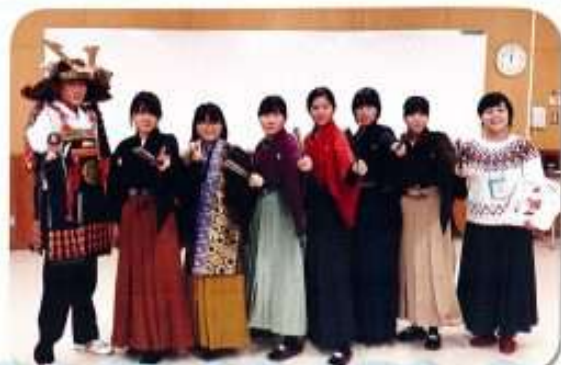
2019年12月、お城EXPO(横浜)で地域協働部の生徒が丸岡城の歴史を寸劇で紹介。大喝采を浴びました。