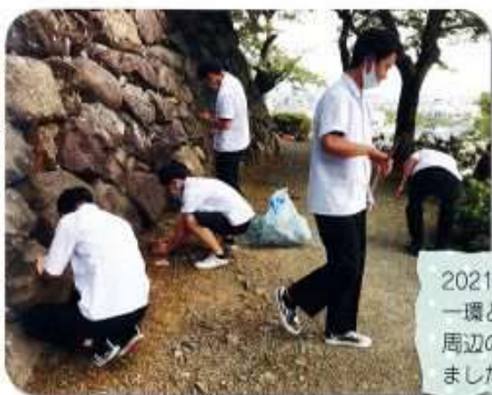
2021年秋、3年Mプロの一環として、丸岡城天守周辺の清掃活動が行われました。