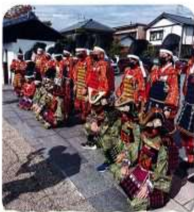
2021年10月16日、市民の会が主催した「丸岡館着初め式」に丸岡高校生も参加し、城のまちコミセンから國神社まで行進し、勇ましい武者姿に沿道から拍手が贈られました。