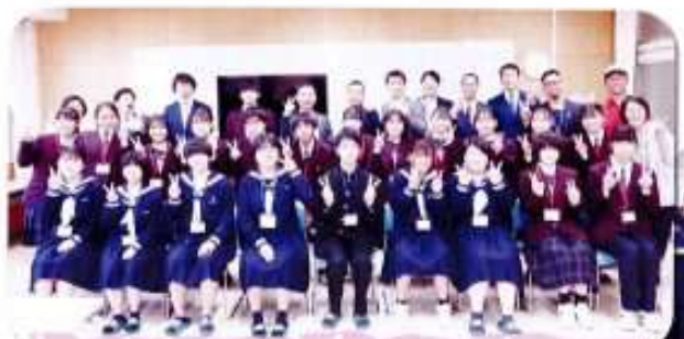
2022年5月、県内若手経営者の団体「経営研究会」の方々が来校し、交流を図り、地域の未来について語り合いました。