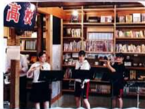
2021年9月、吹奏楽部の生徒が、城小屋マルコでミニコンサートを実施しました。