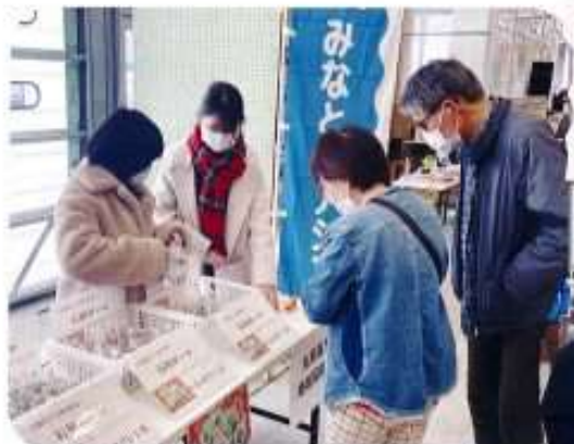
2021年冬、三国湊市場開きに地域協働部の生徒が参加し、地域協働部が開発した「石垣ポーロ」を販売しました。