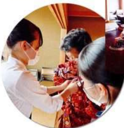
2022年5月25日、京都から専門家を招いた「鑑着付け研修会」が市民の会主催により一筆啓上茶屋2階で行われ、地域協働部の生徒が参加しました。