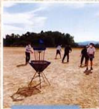
ディスクゴルフ体験

スポーツの多様性について学び、スポーツ実習を通して地域活性化や将来の福井県の発展を見据え探究を深めていくことが特徴です。また、最新の体組成計で自分の身体を知り、トレーニング方法やスポーツ心理学、栄養学など様々な専門知識を学び、自分の将来の夢に向かって取り組みます。