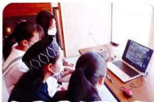
2022年5月、武者鳩マルコで全国の中学生に向けた「地域みらい留学」の説明を、丸岡高校生や卒業生が実施しました。