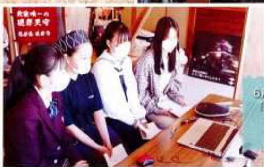
6月4日(土)に行われた「地域みらい留学」のオンラインによる合同説明会の様子