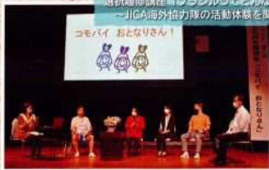
選択履修講座「ブラジルってどんな国? ~JICA海外協力隊の活動体験を聞こう~」