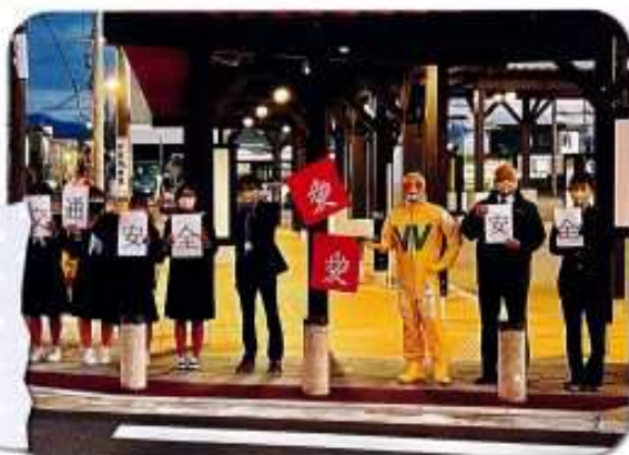
2021年12月、はッピーマンと一緒に、地域協働部の生徒が夜道の交通安全啓発活動を行いました。