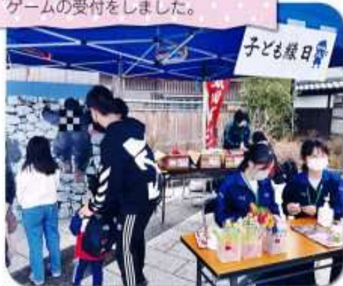
2021年11月、丸岡城西口公園での子ども縁日に地域協働部の生徒がボランティアで参加し、販売やゲームの受付をしました。