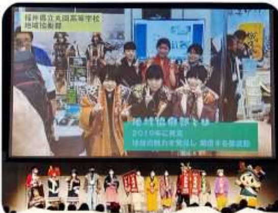
2021年12月、お城EXPO(横浜)で、地域協働部の生徒が、丸岡高校のPRをステージで行いました。