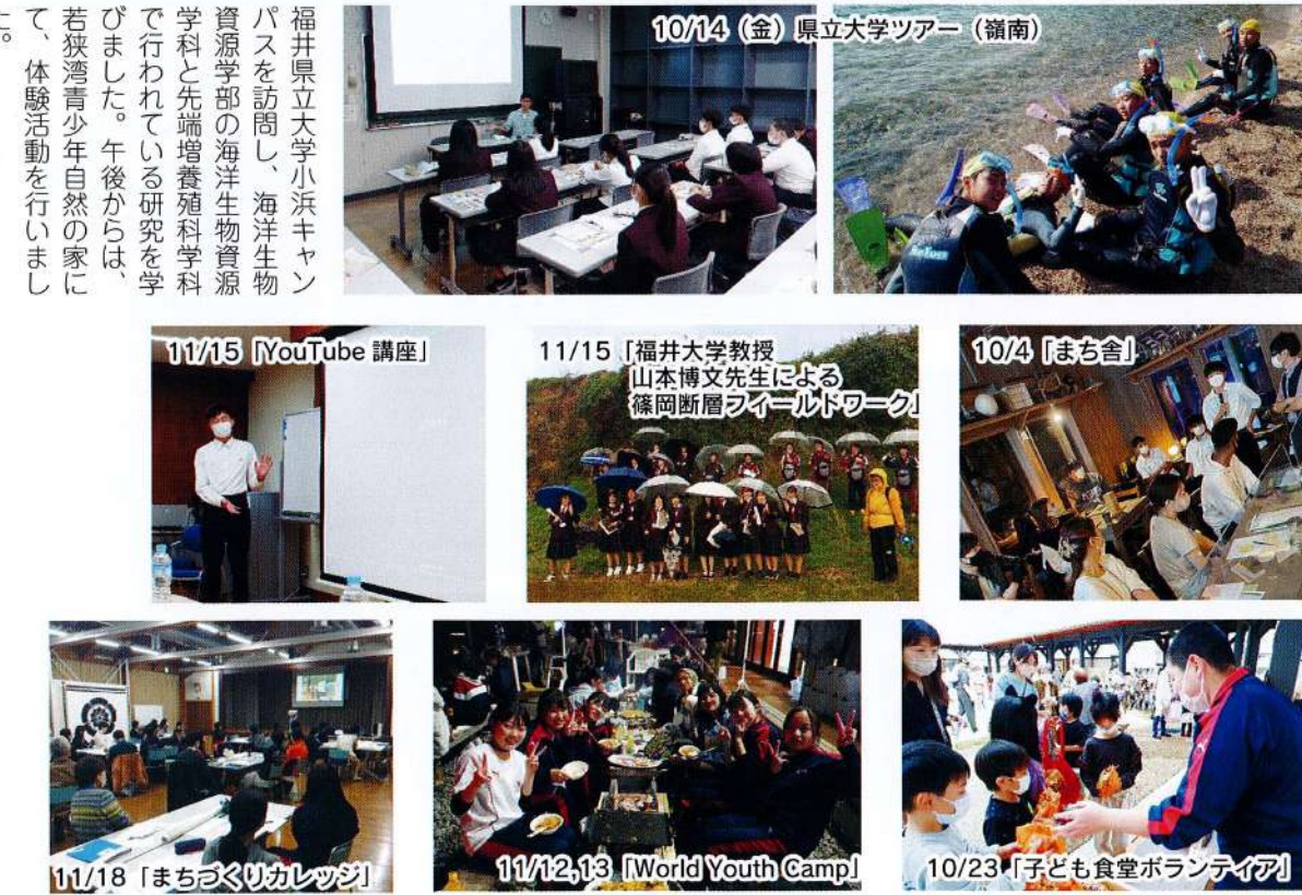
10/14 (金) 県立大学ツアー (嶺南) 11/15 [YouTube 講座] 11/15 [福井大学教授 山本博文先生による 篠岡断層フィールドワーク] 10/4 [まち倉] 11/18 [まちづくりカレッジ] 11/12,13 [World Youth Camp] 10/23 [子ども食堂ボランティア]